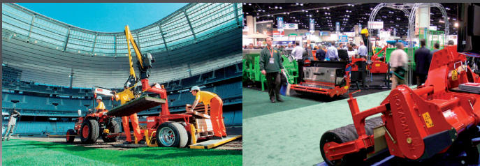
Stade de France