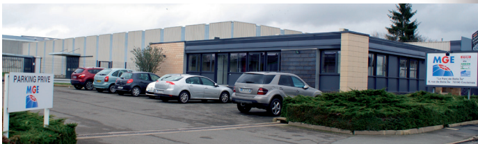
Bureaux et entrepôt MGE