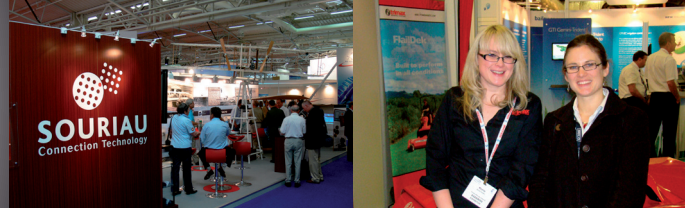
Le Bourget Air Show